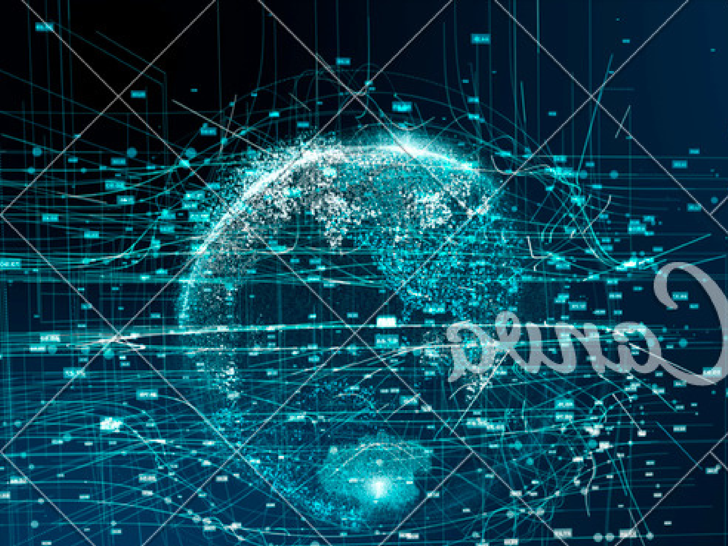
Рис. 1. ЧИ ЗНАЄТЕ ВИ, ЩО ТАКЕ ШТУЧНИЙ ІНТЕЛЕКТ?